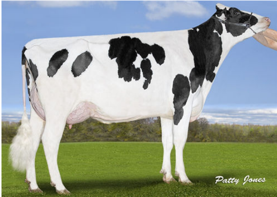
SILVERRIDGE DUKE ELSA-P GRANDDAM